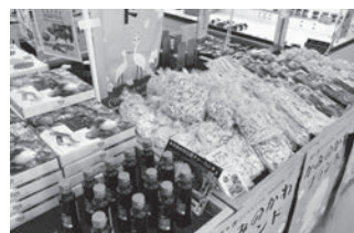
上三川いきいきプラザ農産物直売所

指定管理者である宇都宮農業協同組合と打合せを実施しているが、宇都宮農業協同組合が運営している他の直売所においては、午前中と比較し午後は売り上げが下がる傾向にあることや人件費等の観点から、現時点では午後1時までの営業としている。