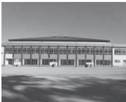
緑地を一部撤去した現在の富士山公園

答 町長 富士山公園の緑化率は50%が基準とされているが、国民体育大会開催に伴い、緑地の一部を撤去したことから、現在は約48%となっています。役場本庁舎改修工事のため、現在は仮庁舎の臨時駐車場として使用しています。改修工事完了後は使用しなくなるため、緑化率の基準を満たすよう緑地の確保に努めていきます。