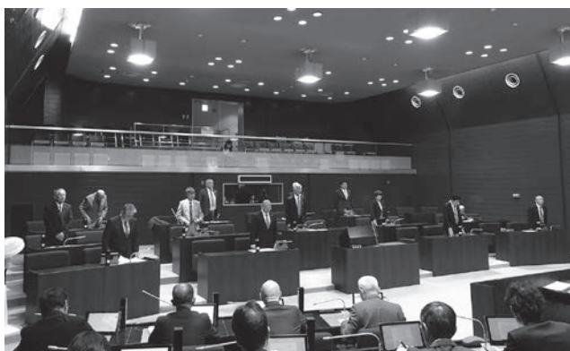
審議している議場の様子

議案は、通常町長から提案されますが、議員又は委員会からも提案することができます。主に、条例の制定や改正、意見書などを提案します。