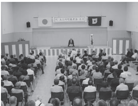
令和6年度敬老会の様子

答 町長 令和6年度敬老会につきましては、9月20日（日）RIGAMプラザ・上三川日産ホールにおいて実施しました。今年度は会場を上三川日産スポーツセンターからRIGAMプラザに変更したことにより、上三川地区にお住まいの方は10時開催の午前部、本郷地区及び明治地区にお住まいの方は午後2時開催の午後部とし、2部制で実施しました。参加人数は、午前の部で約200人、午後の部で約140人です。