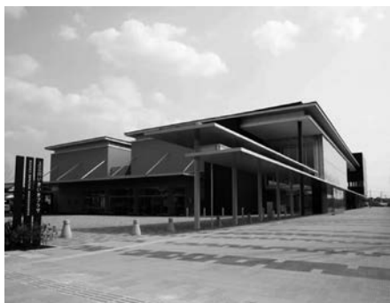
上三川いきいきプラザ

物価高騰により、上三川いきいきプラザの運営経費が増大しており、経費の増加分を使用料に適切に転嫁することで、施設の安定的な財政運営を図るため、使用料の規定について条例の一部を改正するものです。