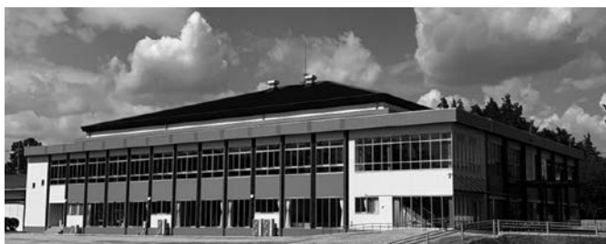
上三川日産スポーツセンター (上三川町体育センター)

「水道法等による権限を厚生労働大臣から国土交通大臣及び環境大臣に移管するための水道法等の改正及び生活衛生等関係行政の機能強化のための関係法律の整備に関する法律」の施行により、水道技術管理者の資格基準等について、条例で規定するために参酌すべき政令及び省令が改正されることに伴い、本条例の一部を改正するものです。