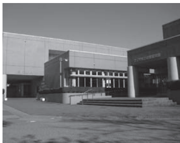
上三川町立図書館