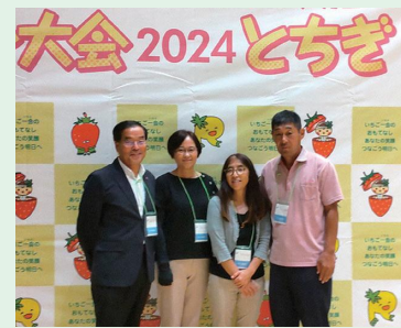
【総合開会式への参加】