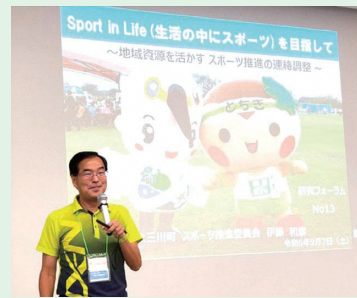
【研究フォーラム 事例発表】