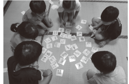
8月2日 子ども人権教室