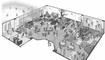
遊戯室イメージパース

雨の日も暑い日も、天候に左右されないあそび場です。遊戯室は、優れたあそびの道具と環境を提供する(株)ポーネランドがプロデュースし、のびのびと体を動かしながら、たくさんの遊具で遊ぶことができます。