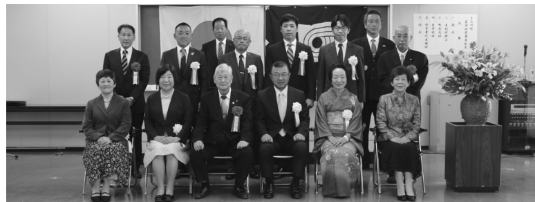
表彰式に出席された皆様