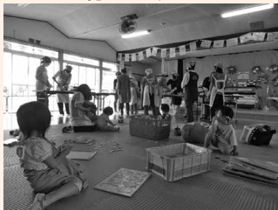
【食生活改善推進員による食育講座の様子】 日々の調理実習。ママが料理する姿を見ながら遊ぶことができました。