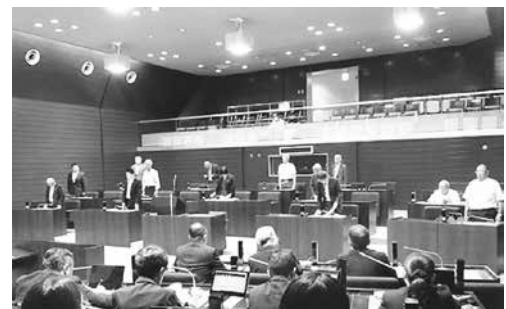
議案を採決する様子