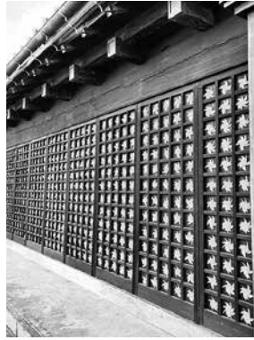
商店会の皆さん発案のフォトスポット<生沼家住宅>