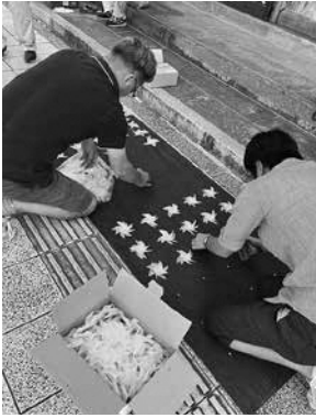
折り紙でフォトスポットを作る商店会の皆さん