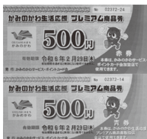
9月19日発売された プレミアム商品券

こうしたことから、地元消費者の町内商店への誘導、町内商店等及び町民生活の支援については、相応の効果があったものと考えています。