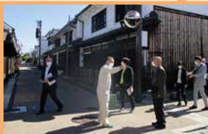
今井町のまち並みを視察(奈良県橿原市)

先進地の取組み事例を学びに他市町村へ行政視察に行っているよ。町でどのように生かせるかを検討しているんだ。町内でも、事業の現状把握のため視察に行っているよ。