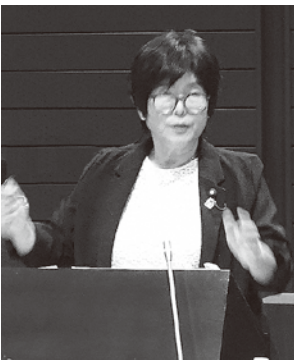
えびはら ともこ 海老原 友子 議員

使用済おむつの持ち帰り廃止の促進を図るため、来年度から使用済おむつの処分費用の補助事業の開始に向け、調整を進めていきます。