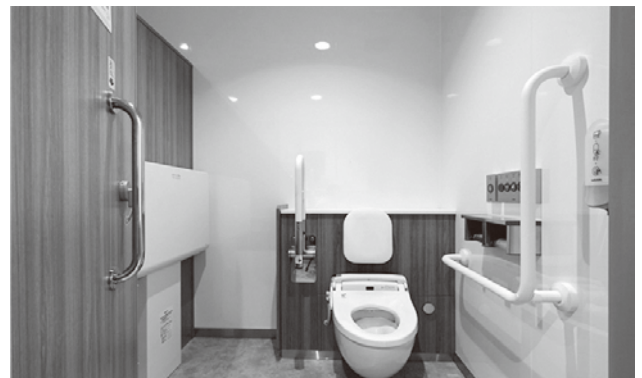
庁舎内部改修工事後のトイレ