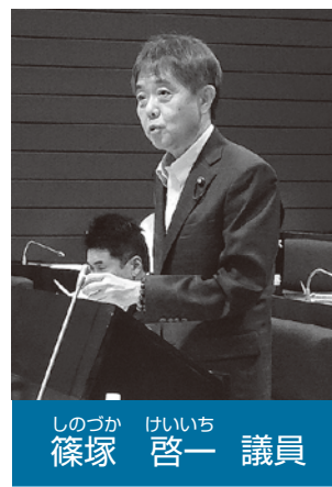
しのつか けいいち 議員 篠塚 啓一

施設を円滑かつ適正に運営するため、敷地内の維持管理及び計画修繕等に関する業務を滞りなく行う必要があり、その作業にかかる日数を確保するため、連続した休館日を確保しています。 令和4年度は、冷水や温水を循環させるためのポンプ設備のオーバーホールや、非常放送設備の更新工事、全館停電が必要となる電気設備の法定点検等を実施しました。