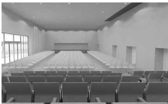
(演奏会等利用イメージ)

【利用料金】多目的ホール(全面)：1時間あたり 1,730円 音響設備：1回 720円