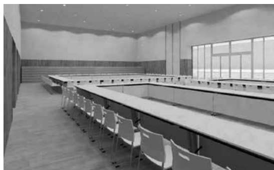
(会議等利用イメージ)