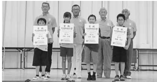
小学生の部入賞選手