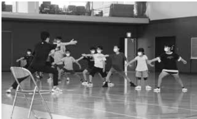
ウォーミングアップの様子

大会当日の参加者は、大人から子供まで幅広く、簡単にできるフェンシングを楽しんでいました。