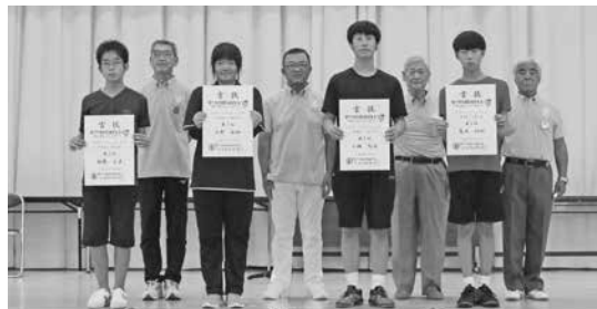
中学生・一般の部入賞選手