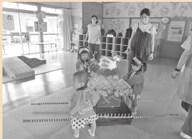
【7月のキッズサロンの様子】 かわいいハッピー姿でお祭り気分を味わいました！