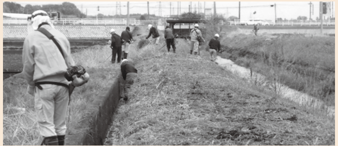
水路の草刈り、泥上げ