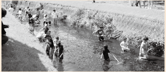
生態系の保全活動（田んぼの周りの生きもの調査）