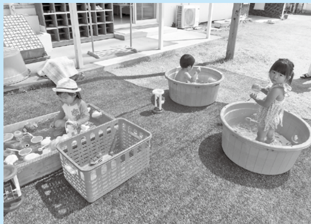
【昨年のプールあそびの様子】 小さなプールで水遊びを楽しみました。