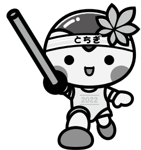
詳細はコチラから