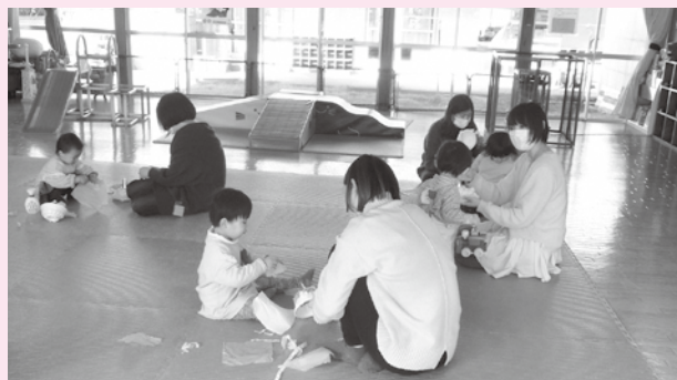
【キッズサロンの様子】ママと一緒に製作をしています。