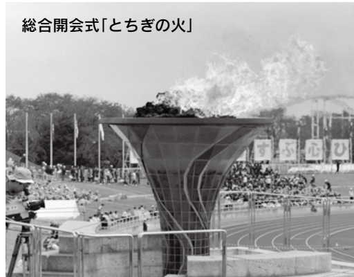
総合開会式「とちぎの火」