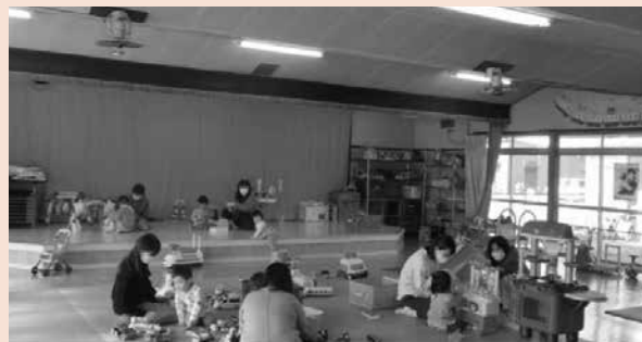
【普段の様子】 ママやお友達と一緒に楽しく遊んでいます。

新型コロナウイルスの感染拡大防止のため、施設の臨時休館又は、イベントを中止することがありますのでご理解願います。