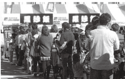
大盛況の黒チャーハンブース

この年も様々な話題があった中、11月にとちぎ元氣グルメまつりにおいて、「かみのかわ黒チャーハン」が準グランプリを獲得しました。この黒チャーハンは、町の商業者や飲食店、若手農家を中心に結成された「かみのかわBQグルメ研究会」が創作したご当地グルメで、町特産の野菜を使い、特製のソースで黒く仕上げられています。ちなみに、「BQ」は「Best Quality」の略だそうです。いまでは町を代表するブランドとなっており、町内の飲食店で味わうことができます。 まだ食べたことのない方は味わってみてはいかがでしょうか。