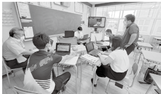
オンライン授業への取り組み(明治中)

授業で使用するだけでなく、今後の休校等に備え、自宅と学校を繋いだオンライン授業にも取り組んでいます。子どもたちの学びを止めないよう、各学校では日々工夫しながらICT教育を推進しています。