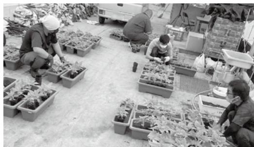
ひまわりの定植作業の様子