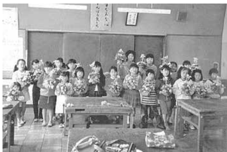
上三川小学校で行われた フラワーアレンジメント教室

今の上三川町は、昭和30年に旧上三川町・本郷村・明治村が合併して誕生しました。さらに遡ると、旧上三川町は明治22年に上三川村、上蒲生村など9か村が合併して誕生しました。(當時は村、明治26年より町)その当時も喧々諤々と議論された末、ようやく話がまとまったのかと思つと、合併の2文字の裏側には数え切れない人々の思いが垣間見えますね。