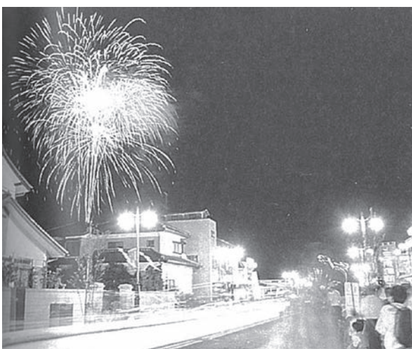
25年ぶりの花火大会

今年の花火大会は、新型コロナウイルス感染症の影響により残念ながら中止となりました。今年は疫病退散 えきびよたいさん を願って全国各地で花火が打ち上がりました。来年はそれらを気にせずに花火が見られることを願っています。