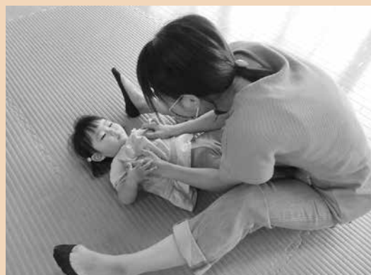
親子で笑顔になる遊びです!

▼開館日 月曜日～金曜日(祝日、年末年始を除く) ▼時間 午前9時～午後4時 ▼利用料 無料 ▼問い合わせ先 子育て支援センター ☎ 56 2043 利用制限がありますので、詳細はセンターや町ホームページでご確認ください。