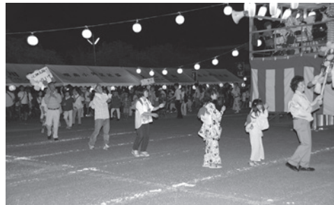
8月18日、明南社協納涼祭