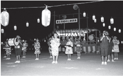
8月15日、めいじ納涼祭

猛暑が続いた8月中旬に、各所ではさまざまな形で盆踊りが行われました。どの会場でも、浴衣を来た踊り手の流れるような踊りに、日中の暑さを忘れる涼しげなひとときでした。