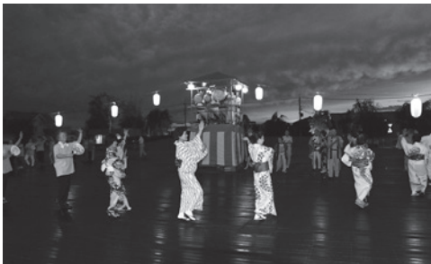
8月16日、文化協会盆踊り(上三川いきいきプラザ)