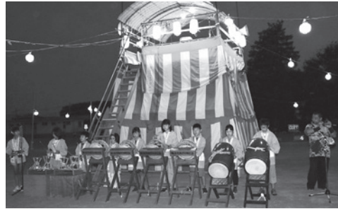
8月18日、ふれあい盆踊り(本郷北小学校)