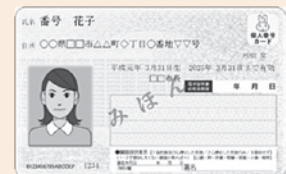
【マイナンバーカード】

事前に交付申請手続き(初回の交付手数料は無料)を行ってください。交付申請については「マイナンバーカード 申請」で検索、もしくは住民生活課総合窓口係へお問い合わせください。