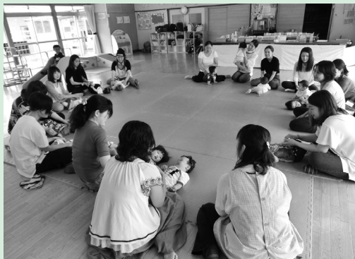
去年のベビーサロンの様子 みんなで体操をしたり、グループトークをしています。

▼問い合わせ先 子育て支援センター『あったかひろば』☎56 2043 詳細は、センターや町ホームページでお知らせしています。