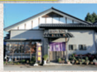
そばや定食などを気軽に味わえる店