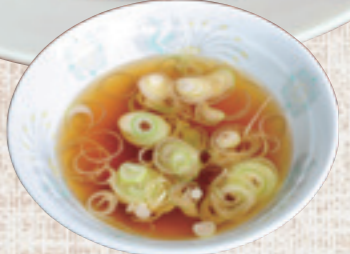
セットでスープが付く

店内にはテーブルのほか座敷もある ●上三川町西汗1662-91 ●JR雀宮駅から車で15分 ●11～14時、17～20時 ●水曜 ●20台