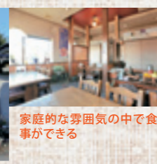
家庭的な雰囲気の中で食事ができる