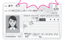
【マイナンバーカード】