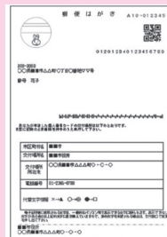
【交付通知書(ハガキ)】

申請者本人が、交付通知書に記載されている必要な持ち物を持参して、受け取りに来庁ください。