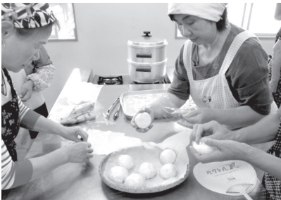
集会所開放事業「炭酸まんじゅうづくり」