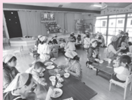
去年のひなまつりの様子 ちらし寿司、茶碗蒸し、ケーキを作ってお楽しみいただきました。