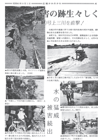
広報かみのかわ昭和61年9月号 当時の台風の被害を伝えています

この台風による降雨は上三川にも多くの被害をもたらし、特に大きな被害としては田川の堤防の決壊がありました。ただ、今では堤防もすっかりきれいになり、あの恐怖を伝えるものを見つけないのは難しくなりました。しかし、茂木町の街中を歩くと、電柱に当時の水位の表示があります。被害の記憶をとどめ、伝える。それは、次の災害に備えるために必要なことなのかもしれません。