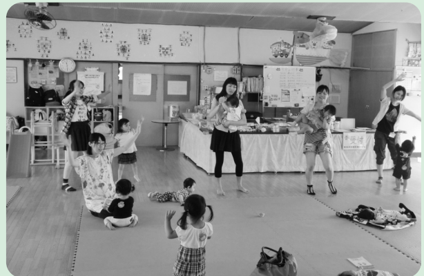
ちびっ子たちも立派に参加しました!