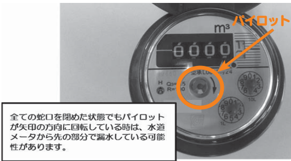
全ての蛇口を閉めた状態でもパイロットが矢印の方向に回転している時は、水道メーターから先の部分で漏水している可能性があります。