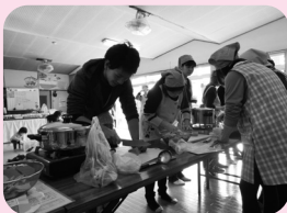
お父さんの参加もあり、みんなで楽しく調理する姿が見られました。