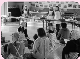
食生活推進員による出前講座で“かぼちゃのスープ”と“おやき”を作りました。