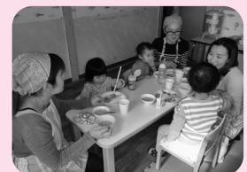
おいしそうにパクパク食べる子どもたち!ぜひ、おうちでも作ってみてください。

「あったか相談」とは… 4月から「子育て相談」の名称が変わり「あったか相談」になりました。 予防接種や離乳食のことなど、普段の生活の中でちょっと聞いてみたいことがあったら、ぜひ来てみてください。 午前10時～12時まで、子育て支援センター「あったかひろば」にて、通常の保育士に加え保健師と管理栄養士が対応します。予約は不要です。 他のママたちの話も聞きながら、気軽にお話しして子育てのヒントを得ませんか？