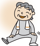
平均寿命と健康寿命の差(国)

今月は健康増進普及月間です。健診を受けてからだの状態をチェックしたり、生活習慣について振り返るなど、自分の健康づくりについて、できることから始めてみませんか？