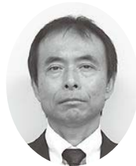
新 上野 延久 五分一・三村・ 愛宕町・下蒲生 ☎56 5 9 0 5