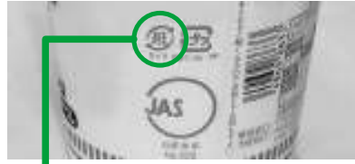
このマークが付いていても、「その他の紙」にならない場合があります。

●朝8時までにご出していただく。その日のゴミの量によって、いつもの収集時間よりも前後することがあります。( ) ●『紙』マークがついているものが、すべて『その他の紙』にはなりません。以下のものは、燃やせるごみで出していただく。