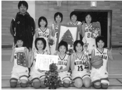
優勝した明南ミニバスケットボールスポーツ少年団