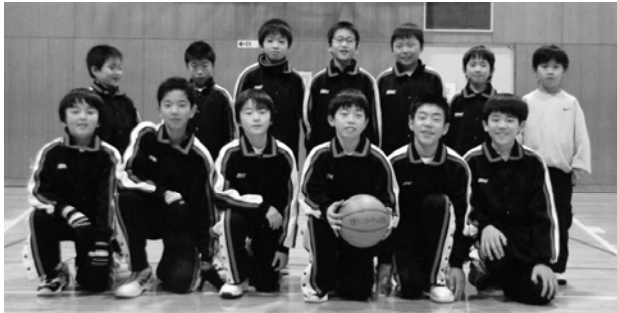
優勝した明南イーグルス