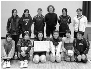
優勝したヴィーナス