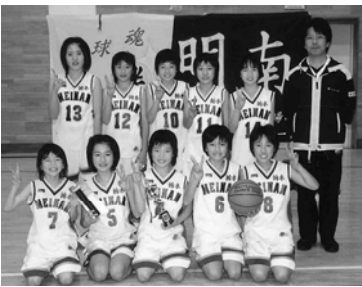
優勝した明南ミニバスケットボールスポーツ少年団