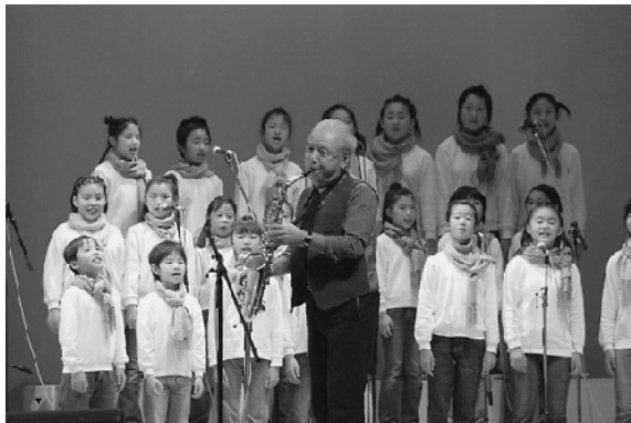
世界のナベサダと夢の共演