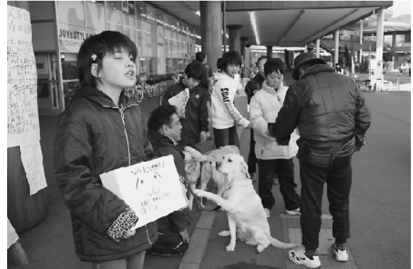
「ご協力お願いします」と大きな声で募金活動

福祉について学習し、補助犬を育てる費用の大半は募金でまかなわれていることを知った6年生が、2日間に分けて募金活動を実施。子どもたちは大きな声で、「ご協力お願いします。」と呼びかけていました。