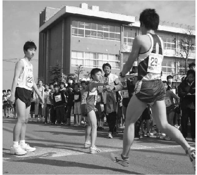
大人から子どもへタスキリレー