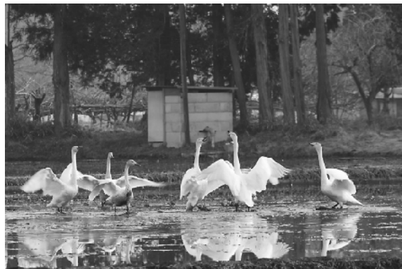
大きな羽を広げるオオハクチョウ

日本野鳥の会の関係者は、「白鳥は環境が良い、安全な場所に訪れるので、非常に良いことだと思います。」と話していました。