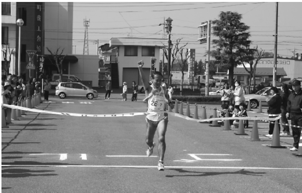
ガッツポーズでゴールテープを切るランナー