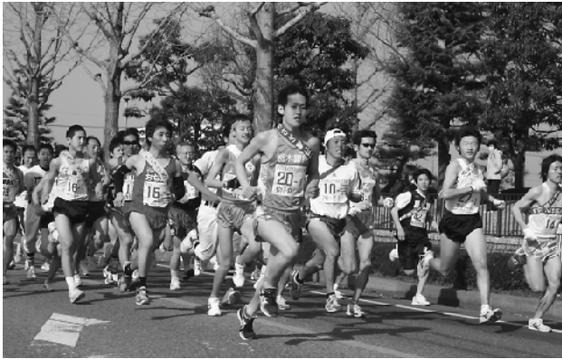
最長区間の1区スタート