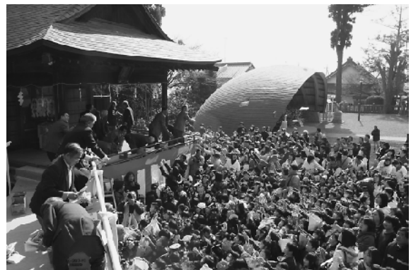
盛り上がりを見せた節分祭

たくさん拾えた人、少ししか拾えなかった人様々ですが、参加した皆さんは、お菓子や豆を縁起物として大事に持ち帰りました。