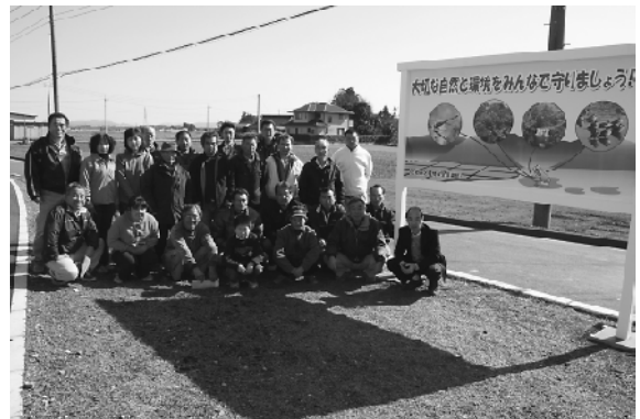
環境保全活動の象徴として立てられた看板

上郷4区環境保全倶楽部では、活動の象徴として更なる環境保全の目標になるよう今回看板を作製。今後も地域内の除草作業や水路の清掃活動などを、会員相互の理解を図りながら進めていくとのことです。