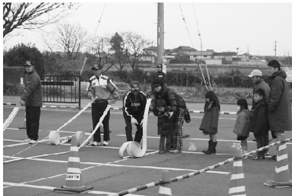
ホース投げ体験をする子どもたち