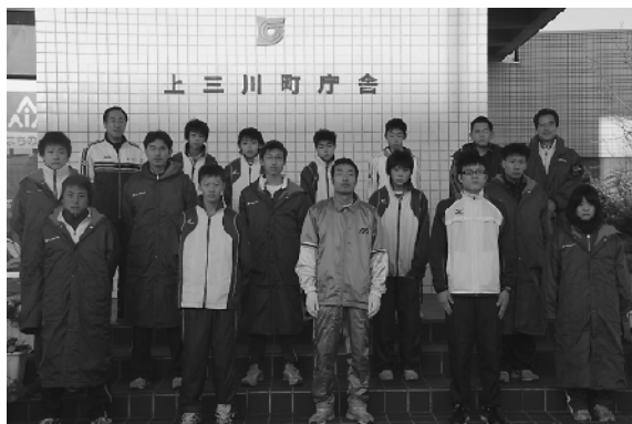
力走した代表の選手たち