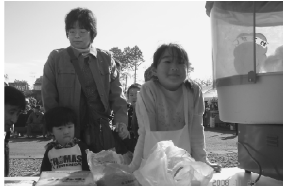
わたあめに列を作る人たち

明治小学校区域の人たちによるドッジボールや輪投げ、グラウンドゴルフが催され、また、売店には多くの人たちが列を作り、牛肉の串焼きやわたあめをほおぼりながら、地域の交流を深めました。