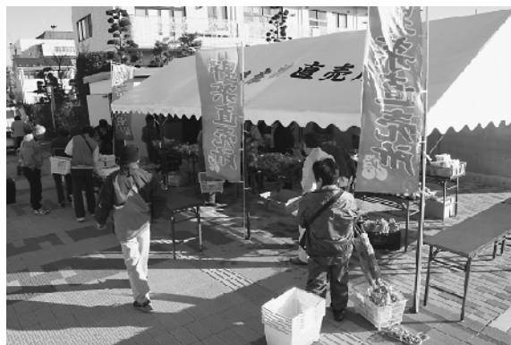
新しいテントでの農産物販売

12月7日から新しいテント等使用し販売を開始。この冬一番の冷え込みとなったこの日は、朝早い時間にもかかわらず、大勢のお客さんが訪れ、新鮮な野菜を買い求めていました。上三川いきいきプラザ農産物直売所は毎週日曜日の朝、野菜の販売を行っています。