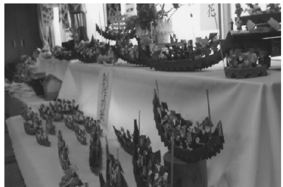
展示された文芸作品

また、日本舞踊も披露されるなど、日頃の創作活動の成果を発表。会員は、有意義な一日を過ごしました。