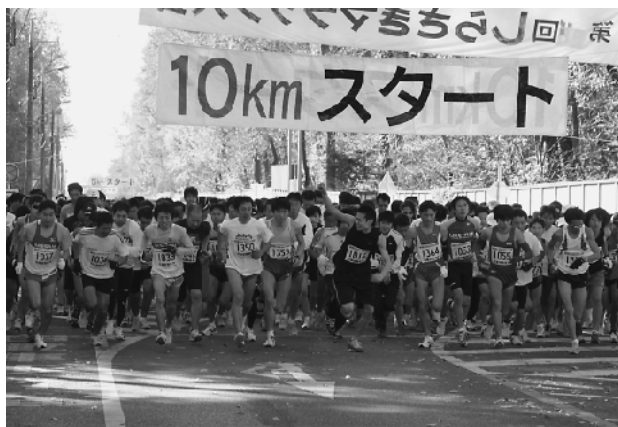
大会の華10kmコースのスタート

延べ1,000人が参加し、毎年恒例のテストコースを走る10kmと5kmコースをはじめ、親子や小学3年生までが走る2kmコースや小・中学生が走る3kmコースなどに参加者たちは分かれて、沿道の声援を受けながら、さわやかな汗を流していました。