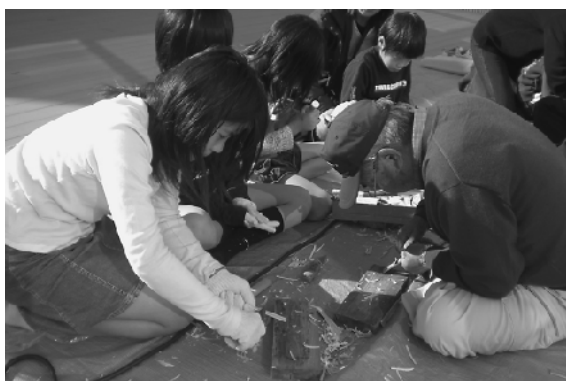
竹とんぼを作製する子どもたち