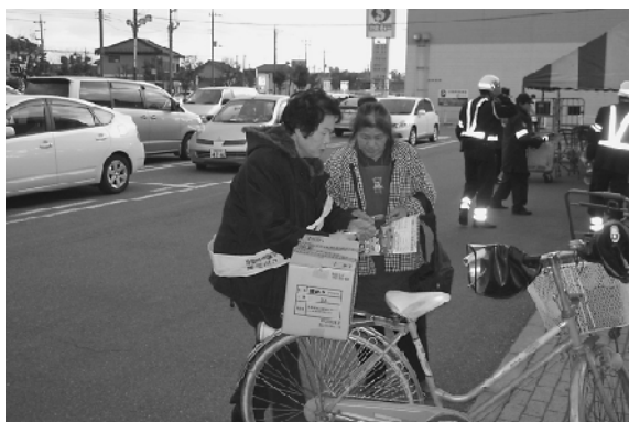
買い物に訪れた人にチラシを配布し啓発