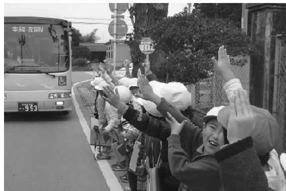
手をあげ元気な声で巡回バスを迎える小学生たち

『私の見学ノート』という社会の授業の一環で、巡回バスを利用し、上三川いきいきプラザを見学。巡回バスやいきいきプラザの説明を受け、ノートに思い思いの感想を書いていました。子どもたちからは、「巡回バスはとっても楽しくて気持ちよかった。」と好評でした。