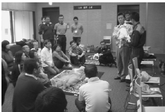
真剣な表情で乳幼児の蘇生法の指導を受ける参加者