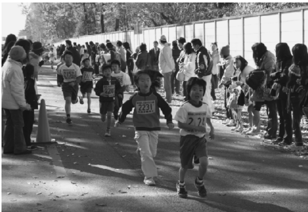
沿道の声援を受けて笑顔で走る子どもたち