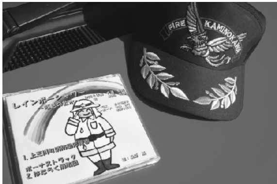
消防団の応援歌「レインボーシャワー」