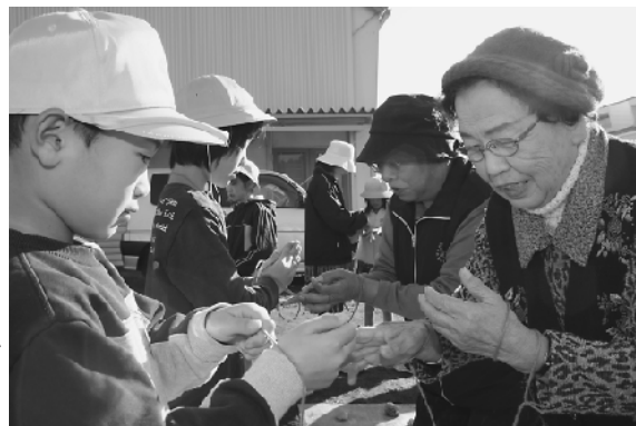
あやとりにいざ挑戦

この授業は総合的な学習の一環で、昔の生活について学ぶため、地域の高齢者にお手伝いいただき、竹馬やお手玉などの昔遊びを体験しました。あやとりでは、「熊手」などができると、子どもたちは喜んでいました。