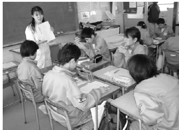
本郷中学校の「ライフスキルに関わる学習」の様子

本郷中学校では、平成15年から実践計画を作成し、「キャリア教育」を実施。自立心や考え方の育成をめざした「ライフスキルに関わる学習」を導入し、キャリア教育の実践校としてその実践が認められました。