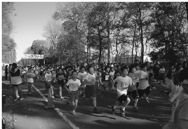
小学校4年生以上のスタート