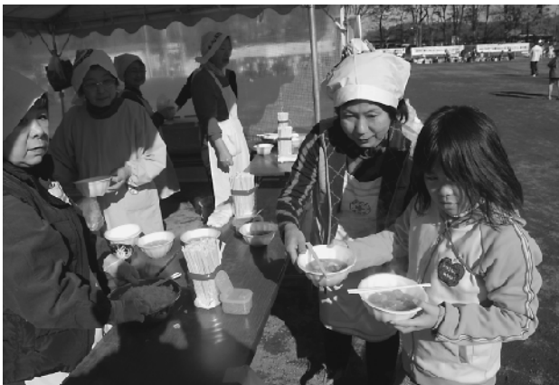
温かい豚汁をどうぞ！