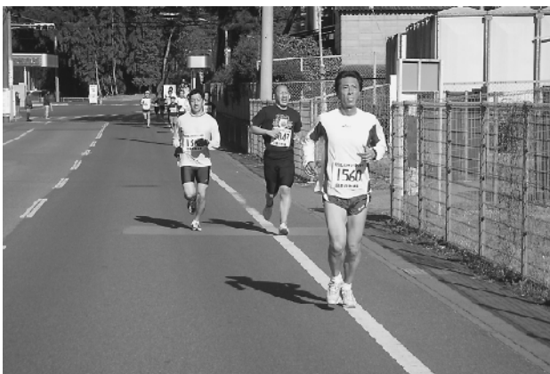
日産自動車栃木工場南門を激走するランナー