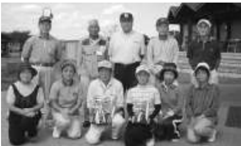
入賞したみなさん