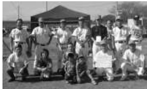
優勝したゆうきが丘