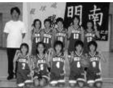
優勝した明南ミニバスケットボール スポーツ少年団