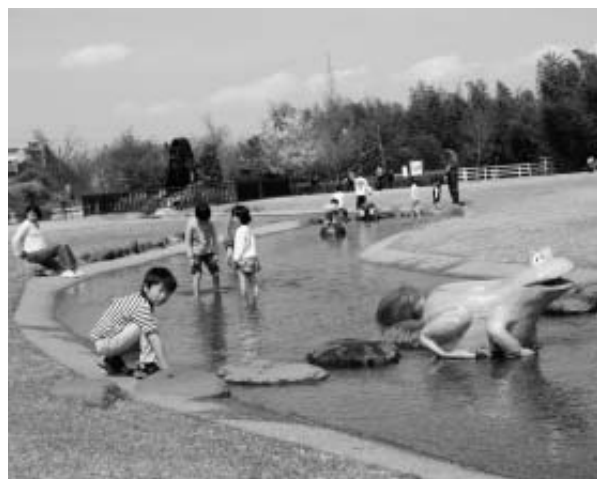
蓼沼親水公園ジャブジャブ池（東蓼沼地内）