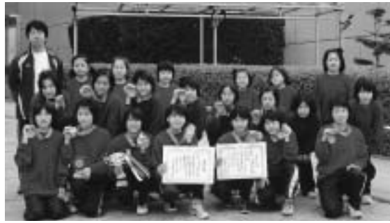
3位に入賞した明南ミニバスケットボールスポーツ少年団

3月28日(金)～30日(日)東京都代々木競技場体育館 第三位 明南ミニバスケットボールスポーツ少年団