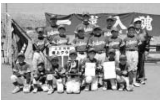
優勝した坂上クラブ