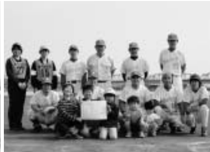
優勝したゆうきが丘第2