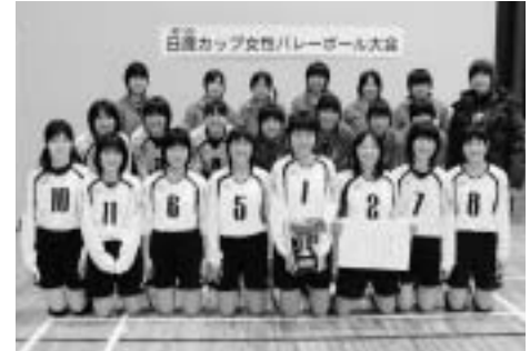
優勝した本郷中学校A