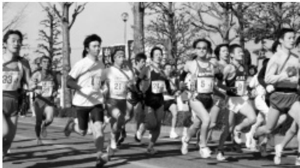
最長区間一区スタート

2月17日(日)、町内1周の7区間をタスキでつなく、しらさぎ駅伝競走大会が開催されました。それぞれのチームがベストを尽くし、1本のタスキを最後までつなぎきりました。