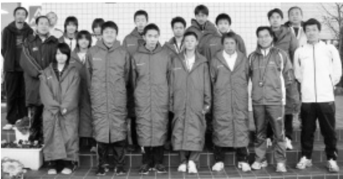
上三川町代表として出場した選手たち