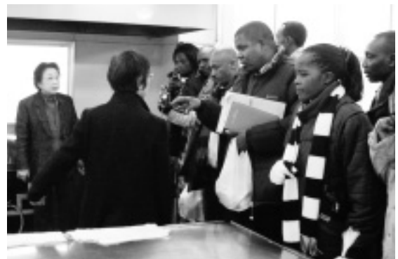
施設内を見学する関係者たち

日本滞在1か月半という長期研修の一端ですが、生活改善について直接グループ員の話聞くことでより知識を高めることが出来、お互い有意義な時間を過ごしました。