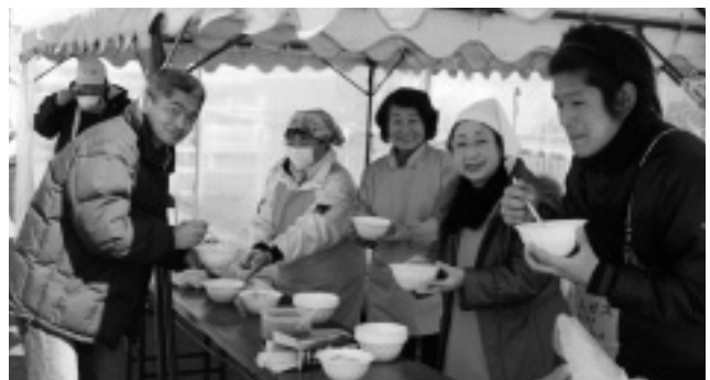
体が温まるボランティアの手作り豚汁