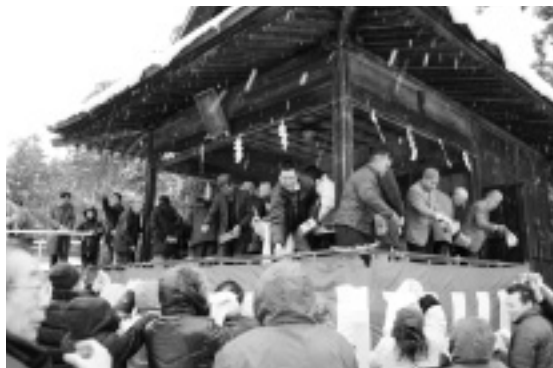
雪の中行われた節分祭

雪の降る中、参加した皆さんは、お菓子や豆などを縁起物として大事に持ち帰りました。