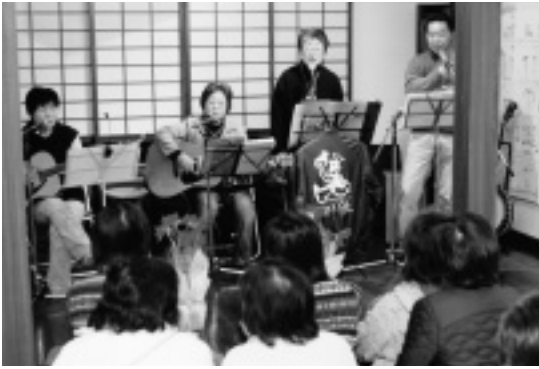
熱唱する「こんぺいとう」のメンバー