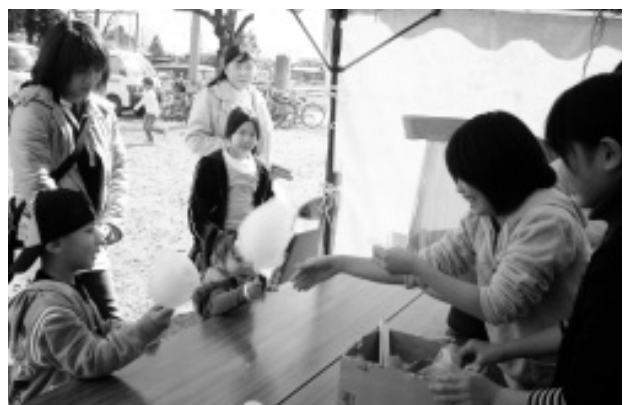
わたあめをどうぞ！（石田コミュニティ）