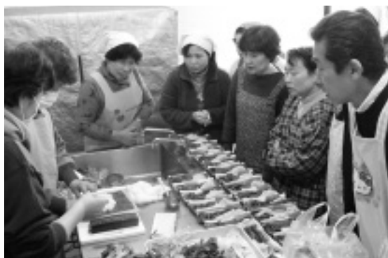
恵方巻きをつくる参加者

今回は、節分にちなんで「恵方巻き」と栃木県の代表的な郷土料理「しもつかれ」でした。調理実習以外にも由来や風習についても話を聞くことができ、参加者に好評でした。