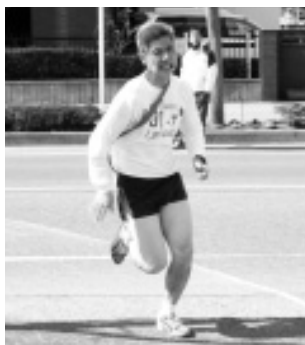
ゴールまであとわずか ガッツポーズでコール！