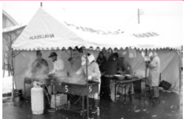
雪の中焼きそばなどをつくる関係者（本郷北コミュニティ）

会場では、コミュニティセンターで培った舞踏やカラオケの発表が行われました。また、焼きそばなどの売店には多くの人たちが列を作り、地域の交流を深めました。