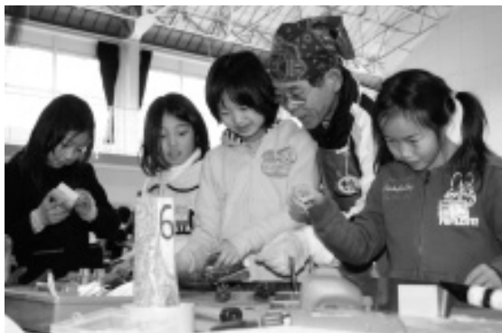
「環境わごん」の人たちと木を使った創作作品を作製