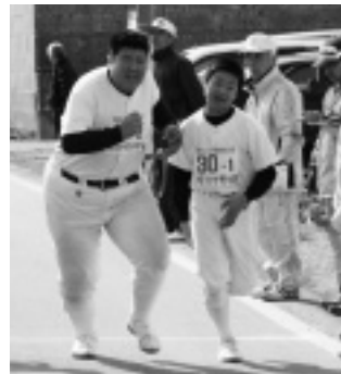
明治中学校野球部・上三川中学校陸上部のスムーズなタスキリレー