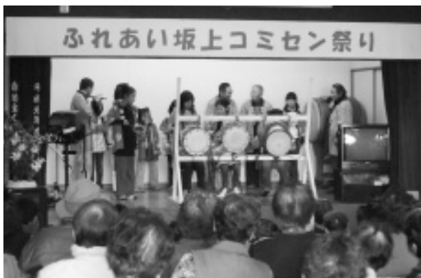
お囃子を披露（坂上コミュニティ）