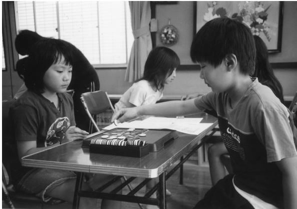
そこに置きちゃうの勝てるかな？ (蓼沼児童館)