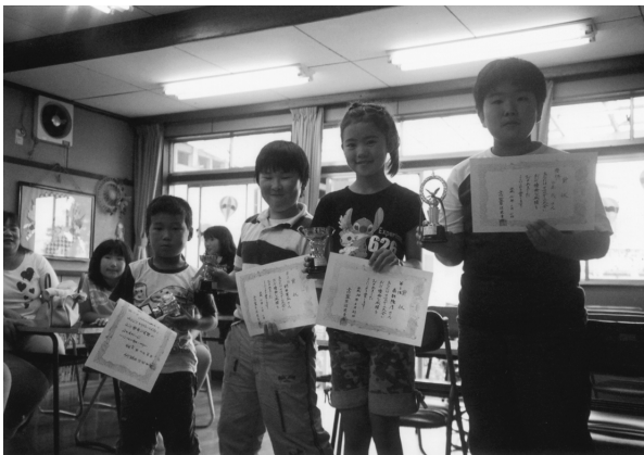
優勝おめでとう！ (蓼沼児童館)