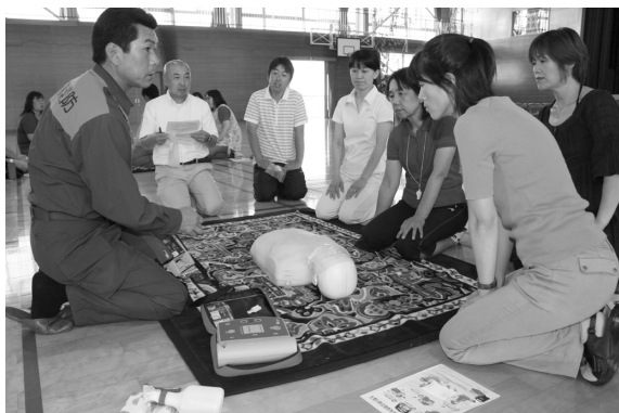
真剣な表情でAEDの使用方法を受講するPTA会員