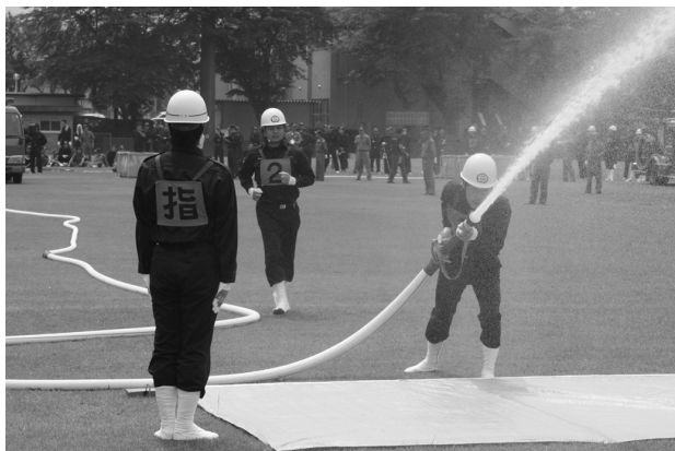
第1線放水始め（ポンプ車の部）