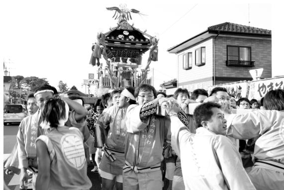
上三川通りを練り歩くお神輿