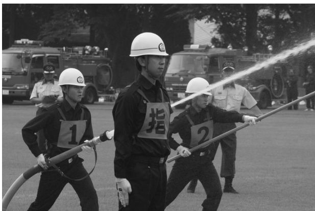
放水始め（小型ポンプの部）