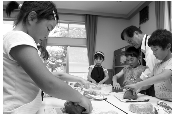
真剣に陶芸に取り組む子どもたち

今回は陶芸教室を行い、明治小学校や明治南小学校の児童たち約100名が参加。子どもたちは、思いを込めて陶芸作品を一生懸命作成していました。