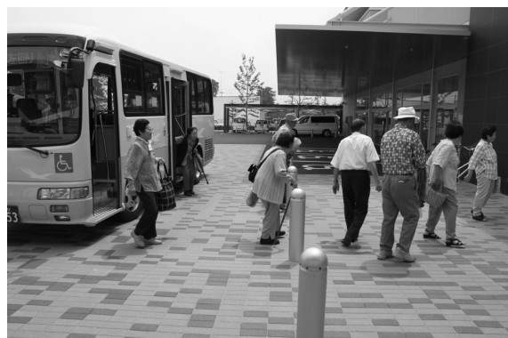
巡回バスを利用し施設を訪れる上郷4区老人クラブ会員

③上三川いきいきプラザでは、見学をされる際には、事前連絡をいただければ、施設内の説明等を行います。また、連絡なしでも窓口まできていただければ、職員が施設の説明をいたしますので、気軽に足を運んで施設を利用してください。