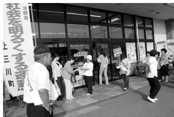
子どもたちの健全育成のため街頭啓発活動

関係団体から87名が参加し、更生保護女性会員による手づくりの雑巾などを配付して、非行防止等を呼びかけました。また、7月9日から3日間、町内の3か所で「ミニ集会」を開催。子どもの健全育成のための地域の関わり方など、熱心に話し合いが行われました。