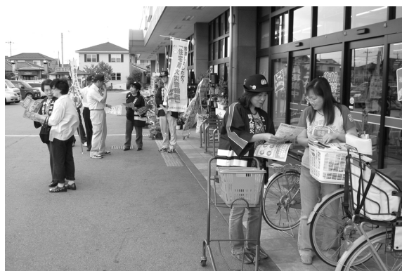
チラシを配布し啓発活動をする会員

③設置場所なども決められているため、詳細については、石橋地区消防組合予防課（☎6166）までご連絡ください。