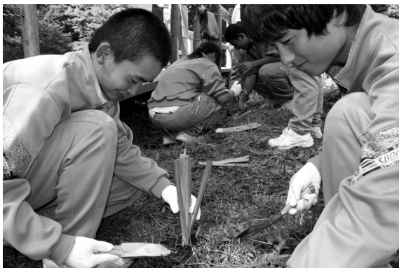
アヤメの苗を植える生徒