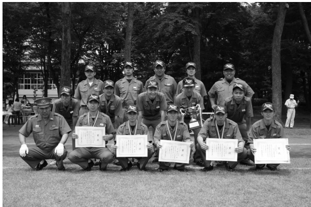
小型ポンプの部で2連覇を達成した第2分団第4部