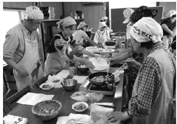
食改推進員の指導を受け手際よく調理を行う参加者

上三川町食生活改善推進員を講師に招き、タマネギ、キュウリやトマトなど地元で穫れた旬な食材を使いキュウリとトマトのチーズサラダなどを作りました。参加者たちは、ご飯の盛る量や塩などを量る際の計量スプーンの使い方などの指導を受け、「家庭で実践できるようにしたいです」と話していました。