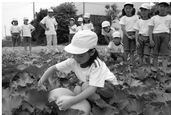
ユウガオの実を収穫する児童

今後は、実際にユウガオの実を剥く作業やふくべ細工を行い、地域の良さを知る体験学習を進めていくとのこと。