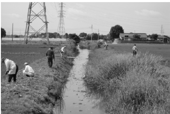
水路周辺の除草作業を行う会員

この活動の一環として、6月15日には、会員約80名が参加し、地域内の除草作業等を実施しました。