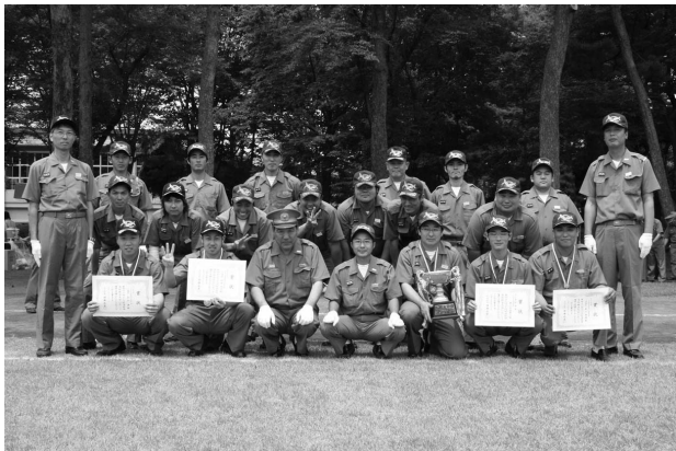
ポンプ車の部で3連覇を達成した第1分団第3部