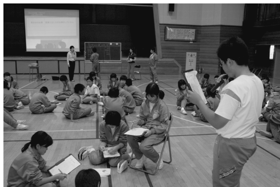
家事分担の発表を行う生徒

生徒たちは、グループごとに分かれて自分の家での家事分担を家族構成ごとに書き出し、改めてその実情を認識していました。