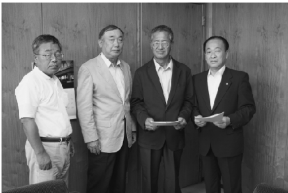
調印式後の活動組織仁平代表・会員と町長