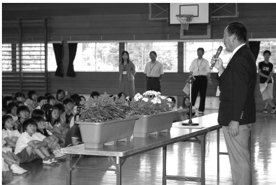
人権擁護委員のお話を真剣に聞く児童たち