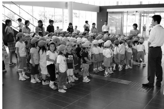
職員から説明を受ける園児たち