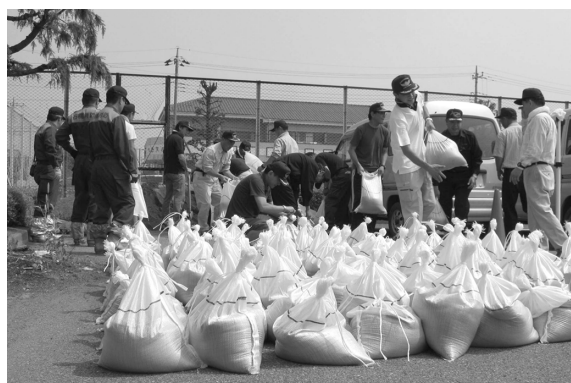
第1分団第3部OB会が作った土のう