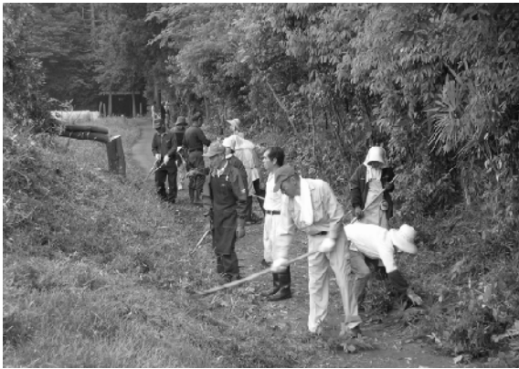
見学に来る人たちのために除草作業を行う会員