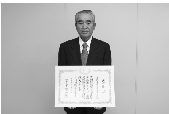
感謝状を受章した上蒲生南老人会カンナを育てる会