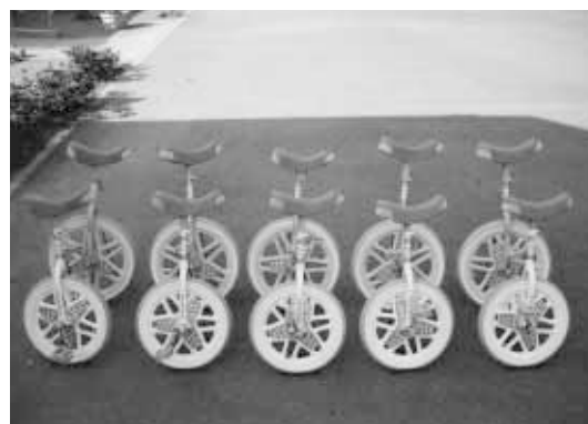
宝くじ助成事業で整備された一輪車

一輪車、シオルター大型メガホン、シュレッダー、将棋セット、かき氷機、笛、乗馬・波乗りフィットネス機器