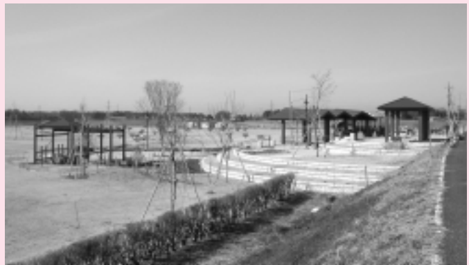
整備が進む田川ふれあい公園