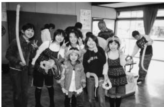
春休みのつどい(バルーンアート) 【夢沼児童館】