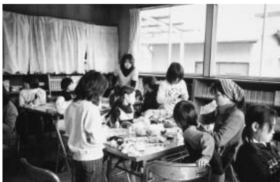
トトロのボンボンマスカットづくり 【願成寺児童館】