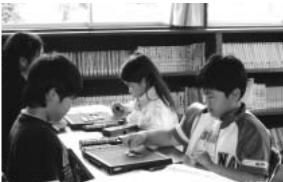
上下：オセロゲーム大会(願成寺児童館)